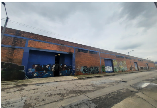
Foto No. 1 Ingreso al predio Calle 22

El día 30 de mayo del 2023 se realizó visita de control al predio de propiedad de la Fiduciaria Davivienda S.A. ubicado en la Carrera 32 No. 22-30 (Foto No. 1 y 2), con el fin de verificar las condiciones actuales de los pozos identificados ante la Entidad con códigos pz-16-0030 (Cervecería Litoral No. 1) y pz-16-0031 (Cervecería Litoral No. 2); sin embargo, durante la inspección solo fue posible identificar una (1) de las captaciones subterráneas.