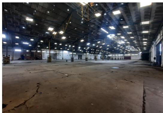
Foto No. 2 Vista interna del predio

Al costado noroccidental del predio se observa una tapa cementada de aproximadamente 1 x 1 metro identificada con una placa DAMA (Foto No. 3 y 4) y al removerla se evidencia la boca de uno de los pozos, por lo que se mantienen las condiciones de sellamiento temporal ordenadas en la Resolución No. 707 del 12 de junio del 2002. Se presume, de acuerdo con la información contenida en el expediente DM-01-CAR-1766, que corresponde a la captación identificada ante la Entidad con código pz-16-0030 (Foto No. 5), sin embargo, hace necesario georreferenciar dentro de la propiedad los puntos de captación de aguas subterráneas para obtener plena certeza de ello.